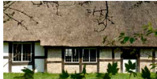
Frilandsmuseet Det Gamle Danmark