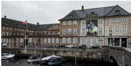
Nationalmuseet i København

Nationalmuseet består af Prinsens Palæ ved Frederiksholms Kanal i København og derudover af en række andre museer og enheder i København, på Sjælland og Møn og i Jylland. Samlingerne blev grundlagt i 1650 af Frederik 3. og blev flyttet til Prinsens Palæ i 1853. Først i slutningen af 1800-tallet blev det kaldt Nationalmuseet.